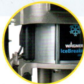
瓦格纳尔行程传感器